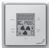
Unité de commande ComfoSense